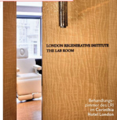
LONDON REGENERATIVE INSTITUTE THE LAB ROOM