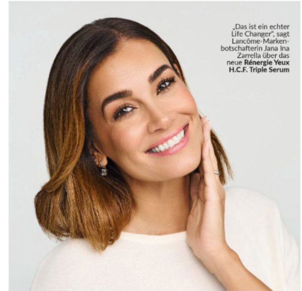
„Das ist ein echter Life Changer“, sagt Lancôme-Markensbotschafterin Jana Ina Zarrella über das neue Rénergie Yeux H.C.F. Triple Serum

Aufgepasst, die Stars und Beautyexperten haben ein neues Skincare-Secret! Ein innovatives High-Tech-Serum macht jetzt allen schöne Augen