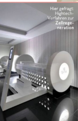
Hier gefragt: Hightech-Verfahren zur Zellregeneration

SPANIEN SHA WELLNESS CLINIC Im Fokus: Gesundes Altern durch Zellregeneration