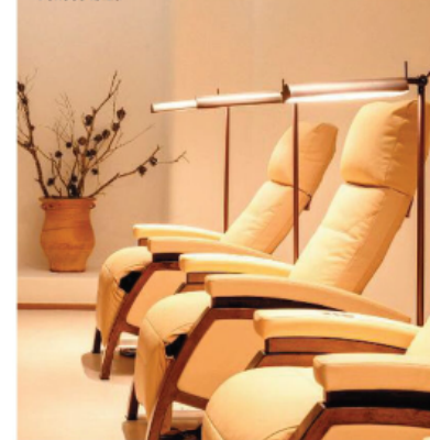
Infusions-Therapie: die IV Lounge des Six Senses Ibiza