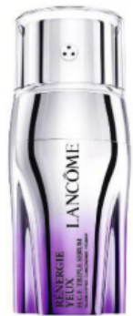
Über den QR-Code geht's direkt zum Produkt

*Klinische Studie mit 84 Frauen nach acht Wochen Anwendung