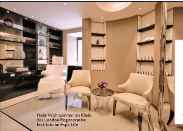
Mehr Wohnzimmer als Klinik: das London Regenerative Institute im Espa Life